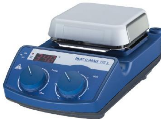
Gambar 1. Hotplate and Stirer IKA C-Mag HS 4